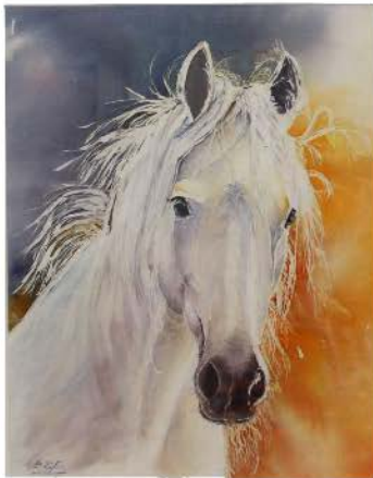
Colette LAFAIRE CORRÈZE