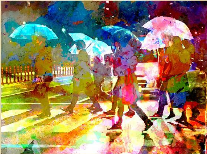
Pierre NOUAILLE http://www.nouaille-p.simplesite.com CORRÈZE