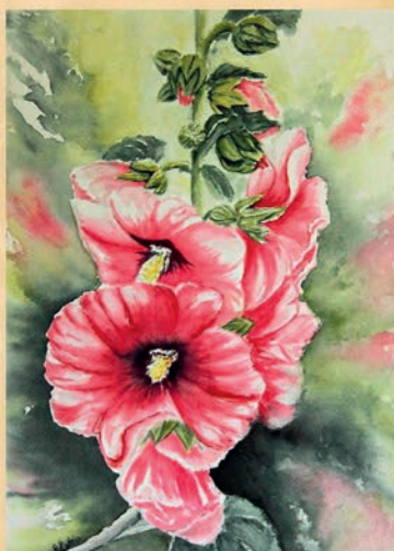
Colette LAFAIRE 628 route de Lauthonie 19490 Ste Fortunade