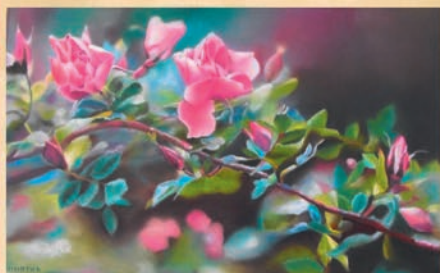
Henriette VINATIER 19 Charissou 19800 Gimel les Cascades