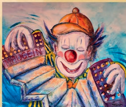
René LAURENSOU laurensou-peintures.com 3 rue des Lilas 19490 Ste Fortunade