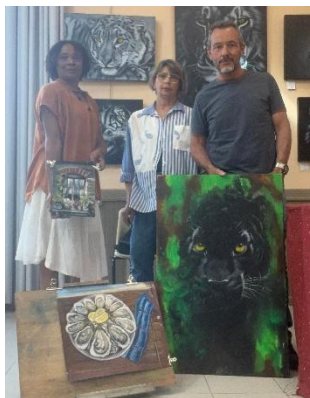
Yves Malhère, peinture acrylique